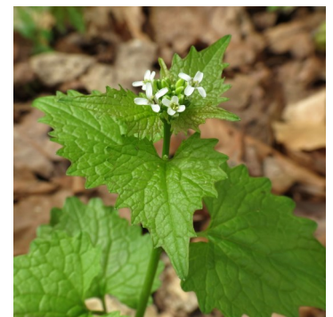
Alliaire officinale

La fin de l'hiver sonne le début des travaux sur le terrain pour l'équipe de la conservation. Inventaires de grenouilles et lutte contre l'envahissement de l'alliaire officinale sont les premières activités au programme. Dès mai, l'équipe pourra compter sur la présence grandement nécessaire de deux stagiaires. Beau temps, mauvais temps, il faudra faire le suivi d'espèces en péril et le contrôle d'espèces exotiques envahissantes sur les terrains appartenant à CIME, ainsi que sur plusieurs autres sites, en collaboration avec des propriétaires privés ou d'autres organisations.